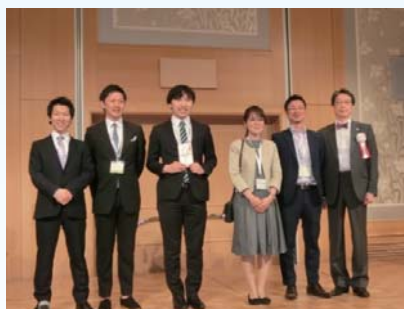
優秀ポスター賞 (一般部門)