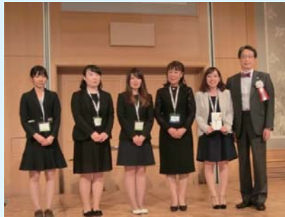
優秀ポスター賞 (歯科衛生士部門)