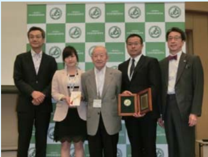
老年歯科医学賞 (渡邊郁馬賞)