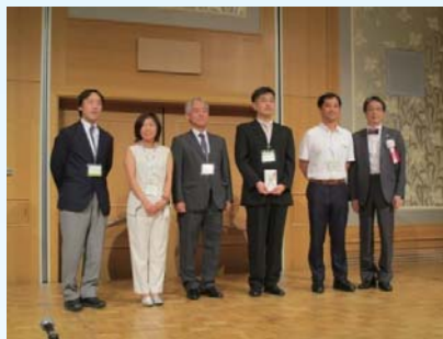
優秀ポスター賞 (地域歯科医療部門)