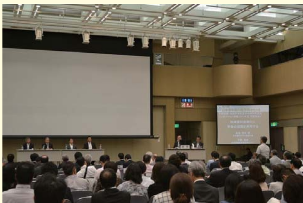
支部組織・地域保健医療福祉検討委員会シンポジウムでの活発な質疑応答の様子