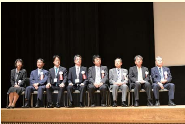
日本老年学会総会における総会会長および7学会の大会長一同